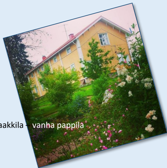
Paakkila - vanha pappila

Matkan hinta 40€ / henkilö. Mukaan mahtuu 50 matkalaista